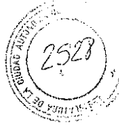
EJEMPLIFICACION p. 8.2.3.3 FIG. 4.